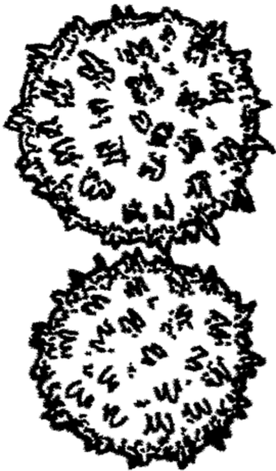
Рисунок 2 - Пыльцевые зерна хлопчатника ( Gossypium hirsutum L.)